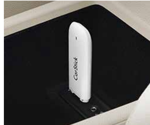
UMTS Carstick Discover Media