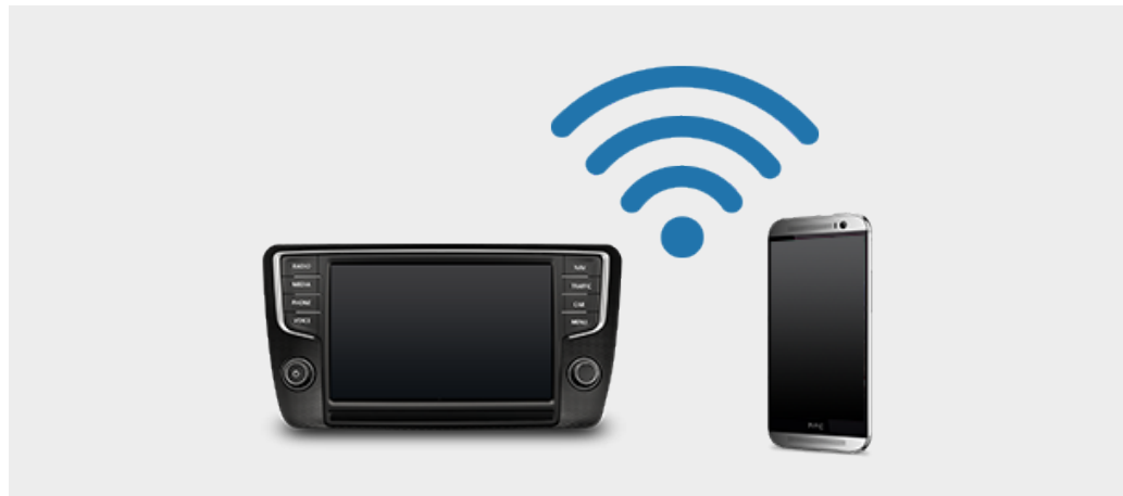
Car-Net über WLAN Discover Pro und Discover Media