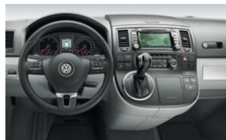
Das übersichtliche Cockpit des Multivan Highline mit Multifunktionslenkrad .