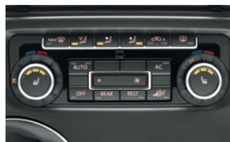
Die Klimaanlage Climatronic mit automatischer 3-Zonen-Temperaturregelung.