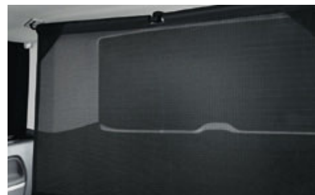
Die Netztrennwand kann hinter der B-Säule oder vor der D-Säule aufgespannt werden.

Abbildungen zeigen Sonderausstattungen gegen Mehrpreis. Weitere Fahrzeugdaten finden Sie im Hauptkatalog „Der Multivan“ sowie im Internet unter www.volkswagen-nutzfahrzeuge.de/grosskunden .