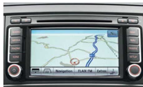
Das Radio-Navigationssystem RNS 510 mit großem, farbigem Touchscreen.