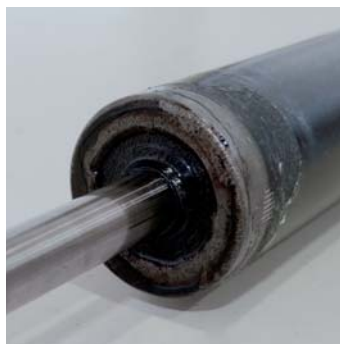
Vorzeitiger Abbruch: ZF Sachs Stoßdämpfer nach 544.175 Lastwechseln