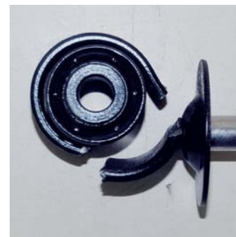
Vorzeitiger Abbruch: KYB Stoßdämpfer nach 600.903 Lastwechseln