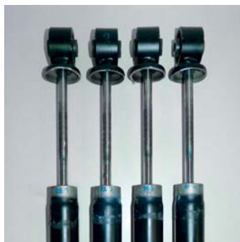
Volkswagen Original Stoßdämpfer nach 1.000.000 Lastwechseln

Bei einem Prüfling brach das obere Dämpferlager nach 600.903 Lastwechseln.